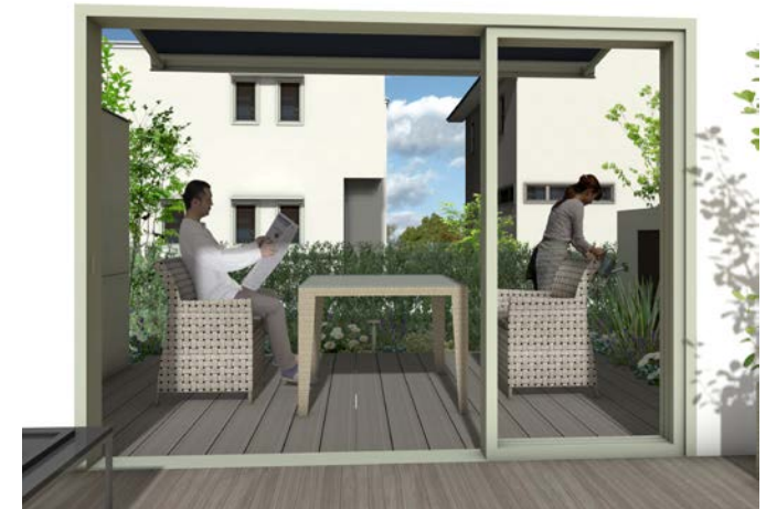
ガーデンファニチャー TYPE003 ダイニングテーブル W1000 TYPE003 1人掛けダイニングチェア

季節を五感で感じることリフレッシュできるように、樹木や草花に触れやすくしたプランです。道路側と隣地側の二つの壁でほどよく視線を遮ることで、好きなことに没頭したり、会話を楽しむ時間を創りだします。